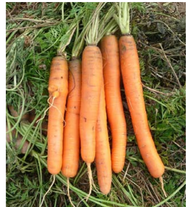
Carboli F1 (RX 04472269)