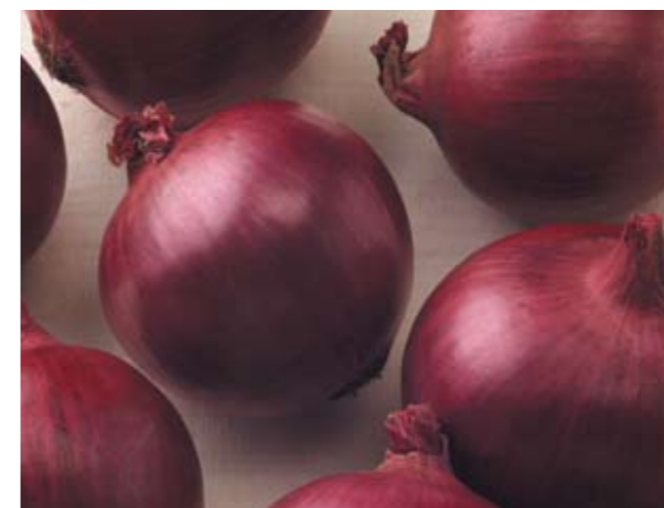
Red Zeppelin F1