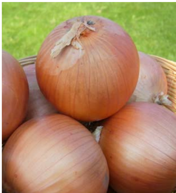
Golden Spike F1

Kiemelkedő termőképességének és a még jó, piaci ár ötvözetének köszönhetően magas árbevétel érhető el. Magasan ülő tulajdonsága miatt a hagymák nem szorulnak be, így elhanyagolható a méreten aluli, vagy deformált termésből származó veszteség.