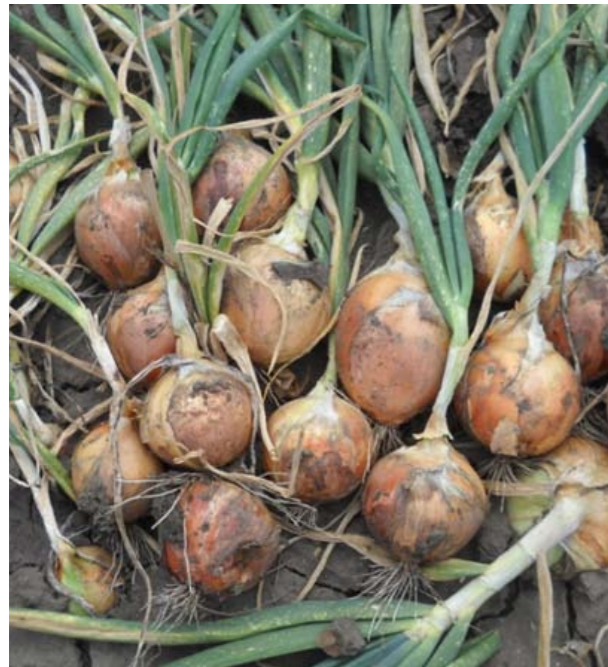
Globe Yellow Danvers