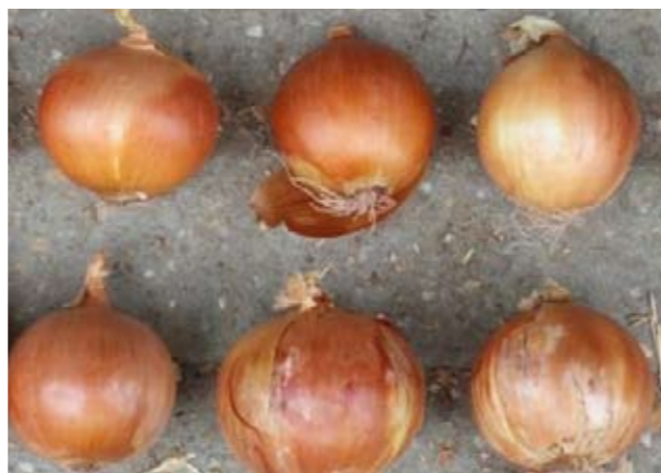
PX 3170 F1